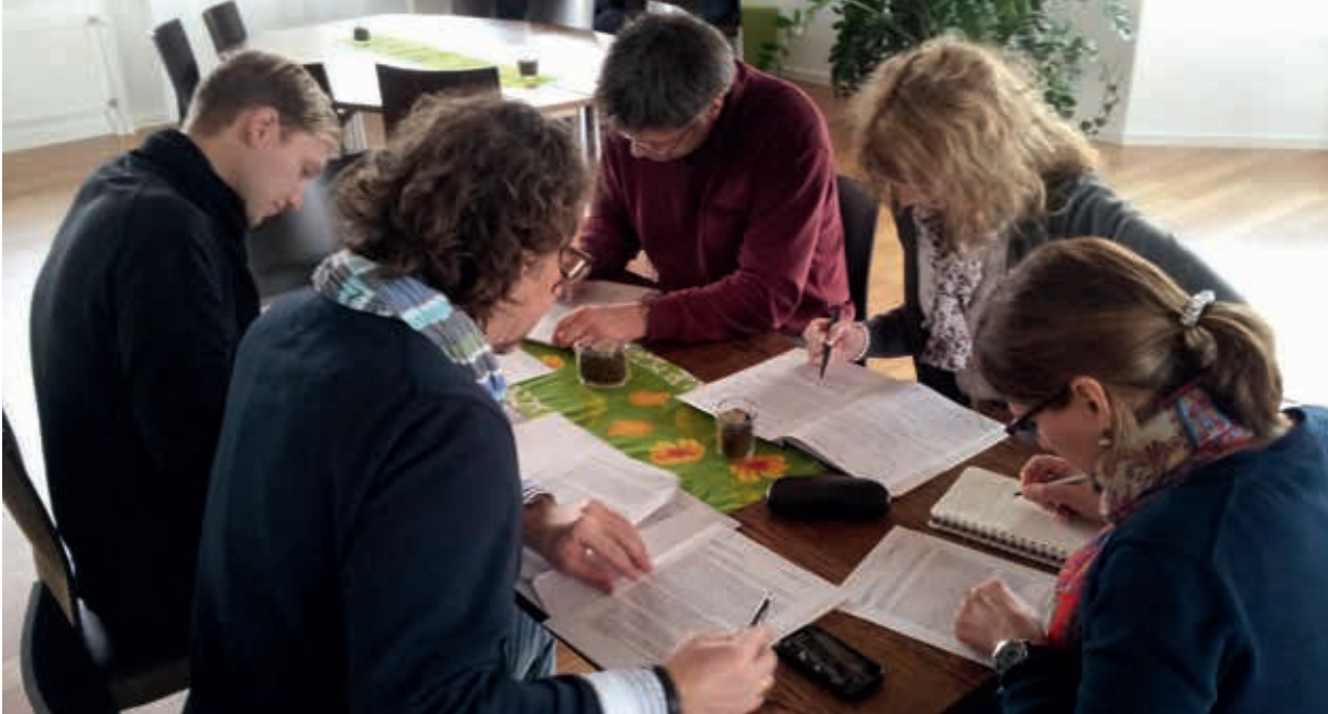
Gruppenarbeit beim ECOanlageberater-Workshop